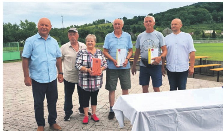
Výhercovia v kategórii „hod ježkami“