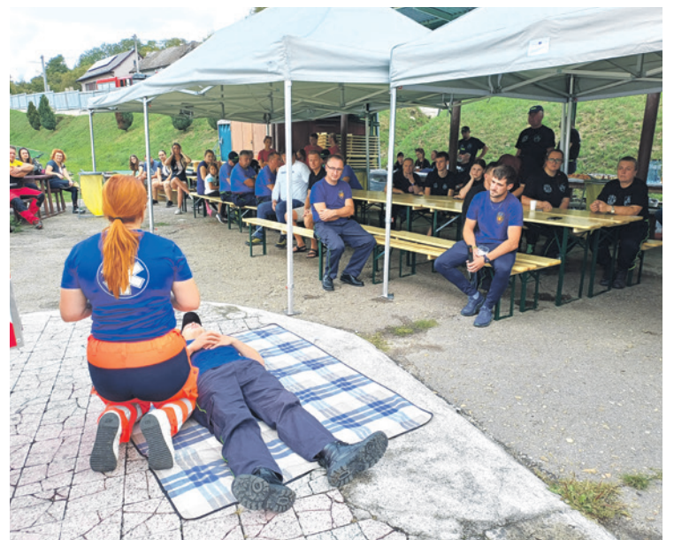
Ukážka podania prvej pomoci na „živej figuríne“