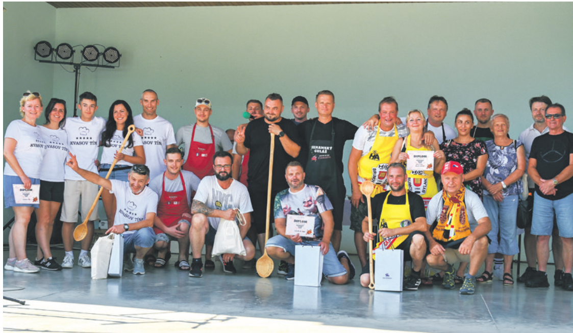
Ocenené družstvá. Zľava: Kvasov tím (2.), Kuchári bez hraníc (1.), Hokejisti Brumov-Bylnice (3.)

V jednom sme však boli veľmi prekvapení, skoro až dojatí – a to v spolupráci a pomoci medzi tímami. Družstvá si ochotne vypomáhali, ak niekomu niečo chýbalo, a vo finále si dokonca