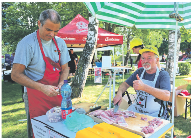
Samotnému vareniu predchádza svedomitá príprava

Tohtoročný Srnanský guláš prekonal všetky doterajšie rekordy – účasťou družstiev aj počtom návštevníkov, ktorí si prišli vychutnať skvelú atmosféru, dobré jedlo a bohatý kultúrny program. Ďakujeme všetkým súťažiacim, hosťom, hudobníkom aj partnerom, bez ktorých by sa Srnanský guláš v takejto podobe nemohol uskutočniť.