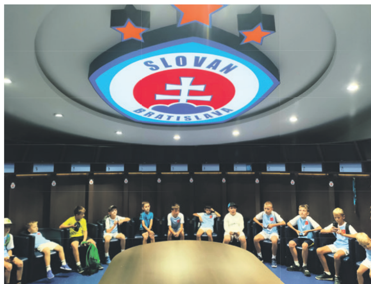
Nový káder FK Slovan Bratislava