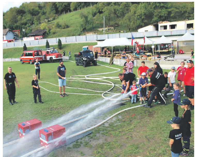
Domáci hasičský zbor pripravil pre mladých hasičov súťaže a iné aktivity

Podujatie sa uskutočnilo v rámci riešenia projektu „Spoločne proti následkum klimatických zmien“, ktorý realizujú obce Horné Srnie, Brumov-Bylnice a Pitín.