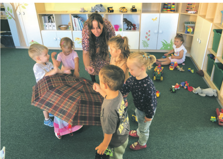
Naši najmenší škôlkari