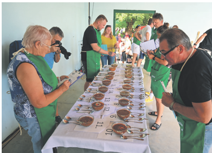
Hodnotenie 19 gulášov dalo porote zabráť