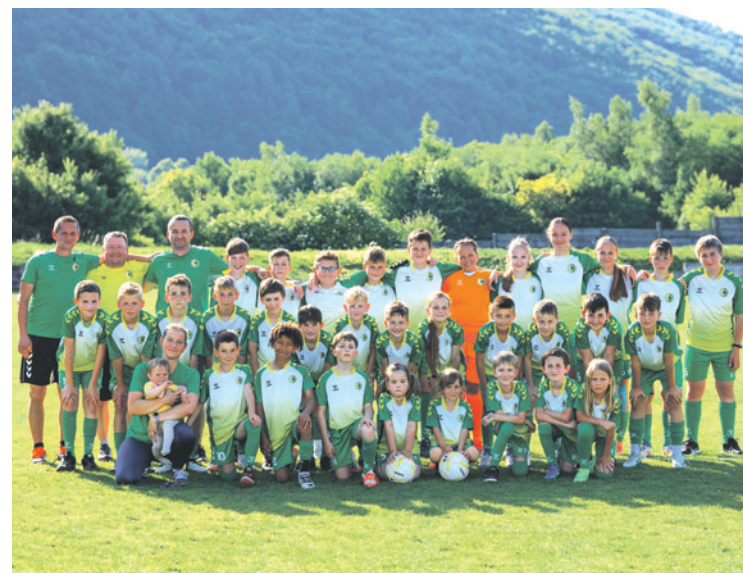
Spoločné foto kategórií U9, U11 a U13.

Keď sme my trénovali, naši rodičia nelenili a deťom vynovili šatňu. Vďaka tomu sme mohli sezónu začať v nádhernej zrekonštruovanej „svätyni“. Materiál sme boli schopní zakúpiť za ušetrené peniaze od sponzorov a zvyšok bol v ržii manželov Karolových a Mareka Horného. Do novej sezóny vstupujeme plní očakávaní a veríme, že deti si každý zápas užijú a odohrajú ho s chuťou a ra-