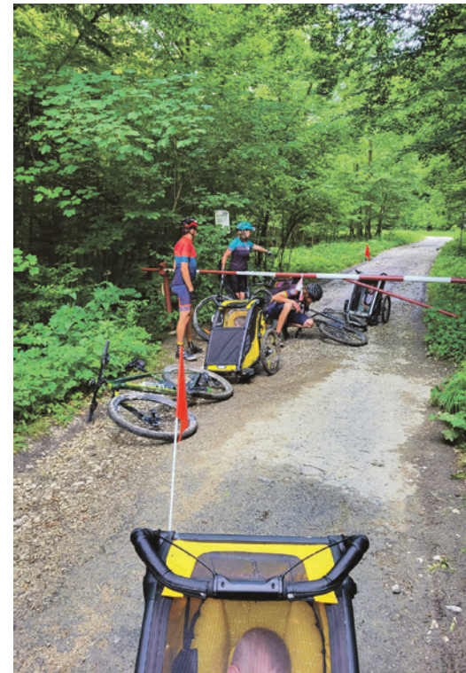
Thule gang na výlete

Súčasne už nepribúdajú, pretože ten čas, ktorý som venoval bicyklovaniu, trávim s rodinou.