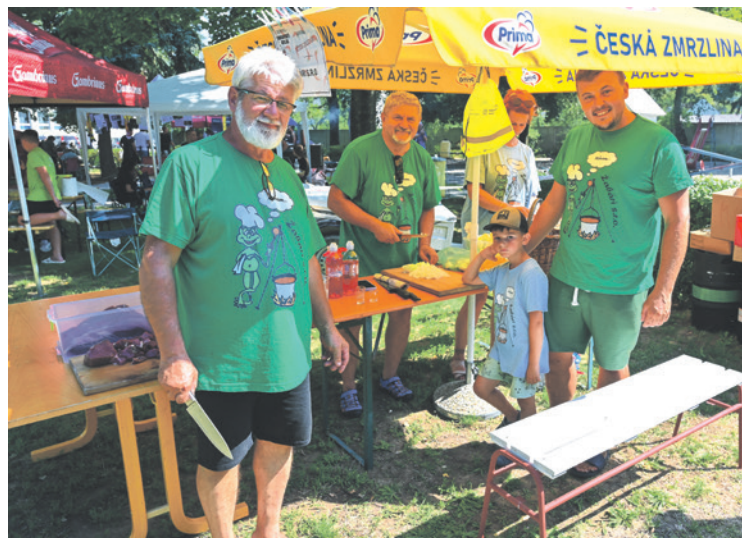
Ruku k dielu priložili malí i veľkí