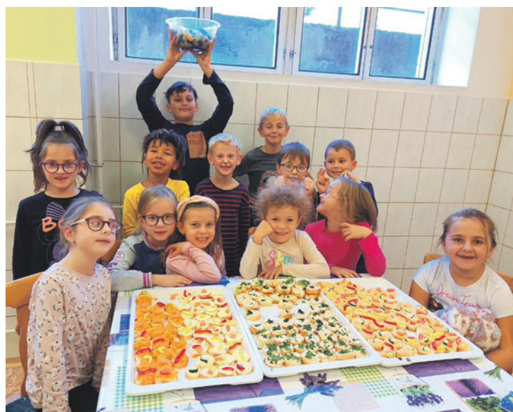
Svetový deň zdravej výživy