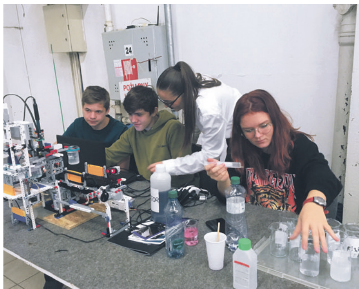
Naši žiaci na Trenčianskych robotických dňoch