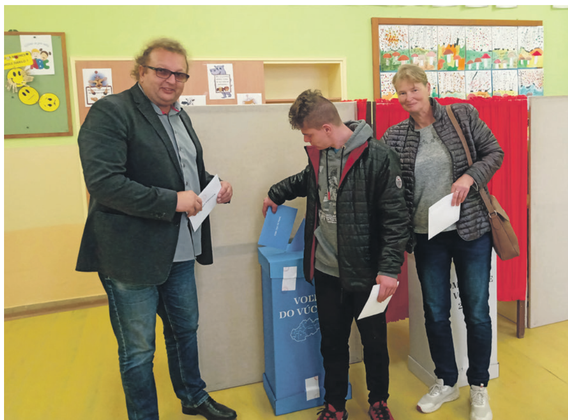
Októbrové voľby priviedli k hlasovacím schránkam celé rodiny i prvovoličov.

V tomto prehľade sú vypísané a zhrnuté len najdôležitejšie body uznesení. Presné znenie uznesení a kompletne zápisnice zo zasadnutí OZ spolu s výpismi z hlasovania poslancov sú k dispozícii k nahliadnutiu na Obecnom úrade v Hornom Srní, ako i na internetovej stránke obce www.hornesrnie.sk .