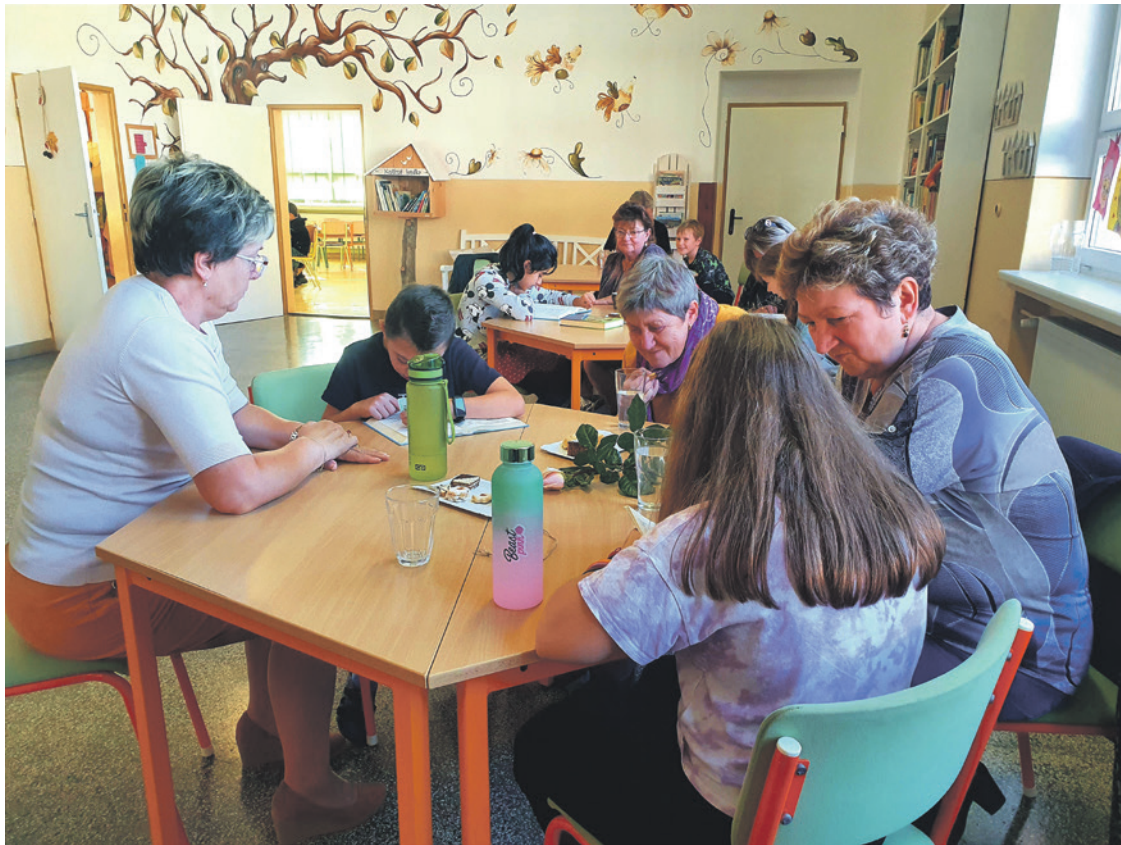
Babka, dedko, podme spolu čítať