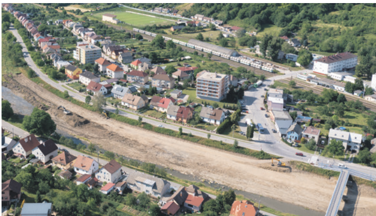
Prehlbovanie riečiska Vláry