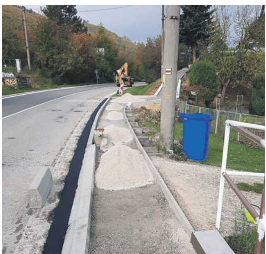
Na jeseň sa podarilo zrekonštruovať chodník v časti Rybníky