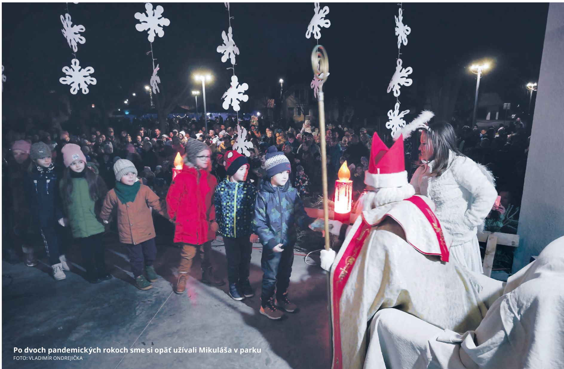
Po dvoch pandemických rokoch sme si opäť užívali Mikuláša v parku

Noviny obce Horné Srnie • lipovec@hornesrnie.sk • ročník XXXI • 4/2022