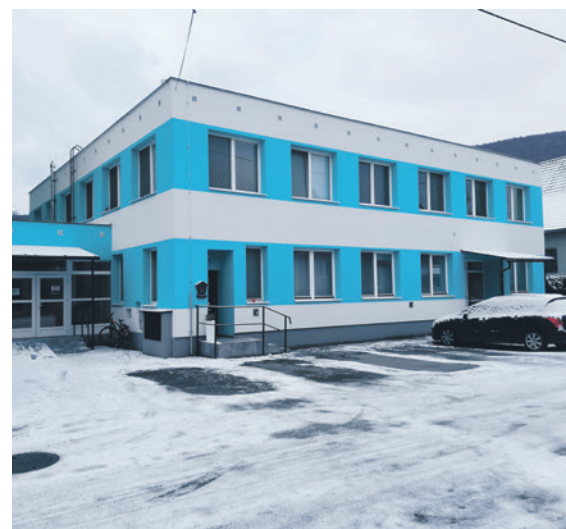
Zdravotné stredisko získalo novú fasádu