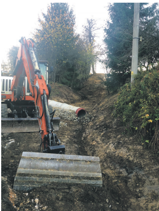
25. októbra začali práce na výstavbe cyklistického chodníka Horné Srnie – Antonstálska dolina. Cyklotrasa bude uvedená do prevádzky na jar 2023