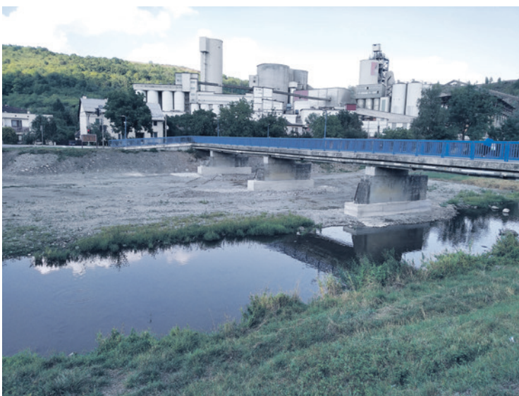
Oprava mostových pilónov