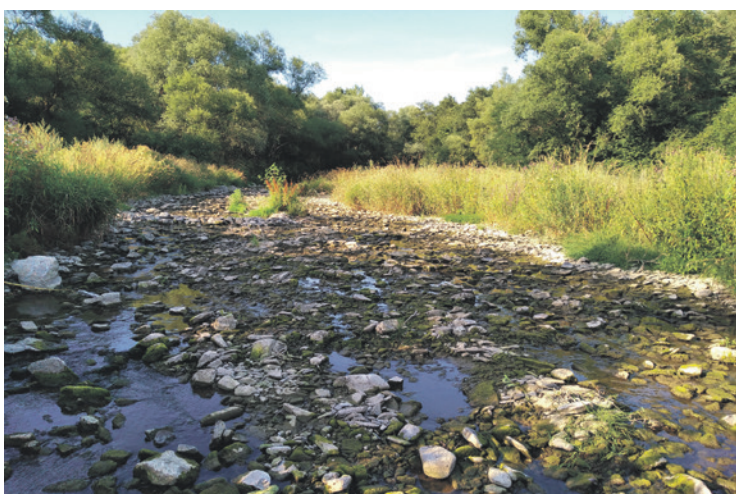
Extrémne suchá v lete spôsobili, že Vlára na viacerých úsekoch takmer vyschla (pohľad od nemšovskej cyklo-lávky na Dupčák)