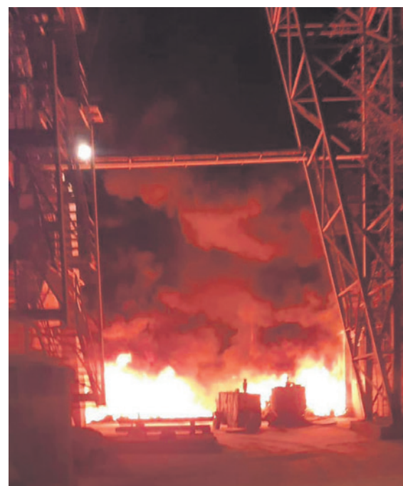
2. 12. vo večerných hodinách vypukol v cementárni požiar. Horeli balíky lisovaného plastu určeného na druhotné spracovanie. Na mieste zasahovali hasiči z Dubnice, Nemšovej a Horného Srnia