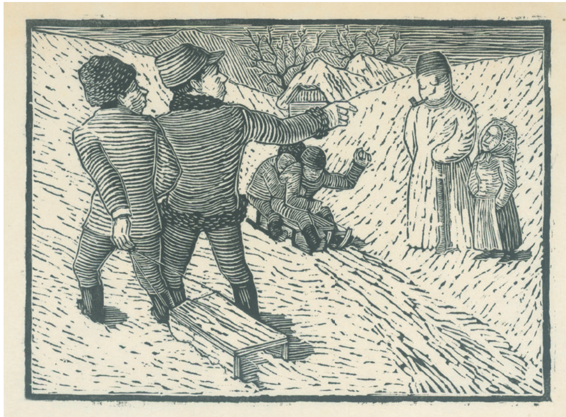
Štefan Bednár: Zima (1926)