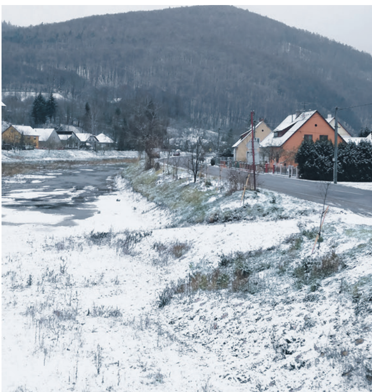
Okolo cesty na Čerňavskej ulici bola vysadená nová stromová aleja. V budúcnosti by mala tvoriť protihlukovú a protiprachovú bariéru