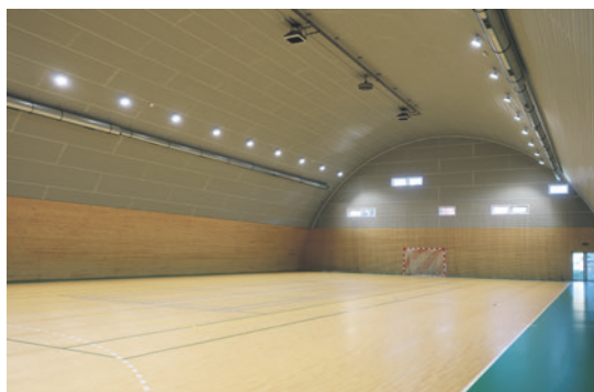
Športová hala zvnútra

Priestory športovej haly si môžete zarezervovať prostredníctvom rezervačného systému na stránke www.hornesrnie.sk v časti Kontakty > Rezervačný systém