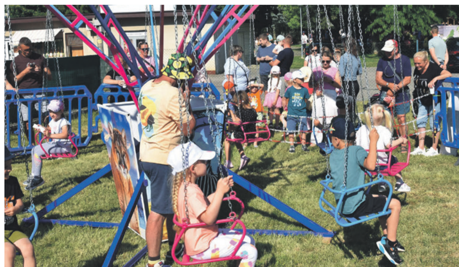
Bez kolotoča by to nebolo ono. Neomrzí ani po stý raz