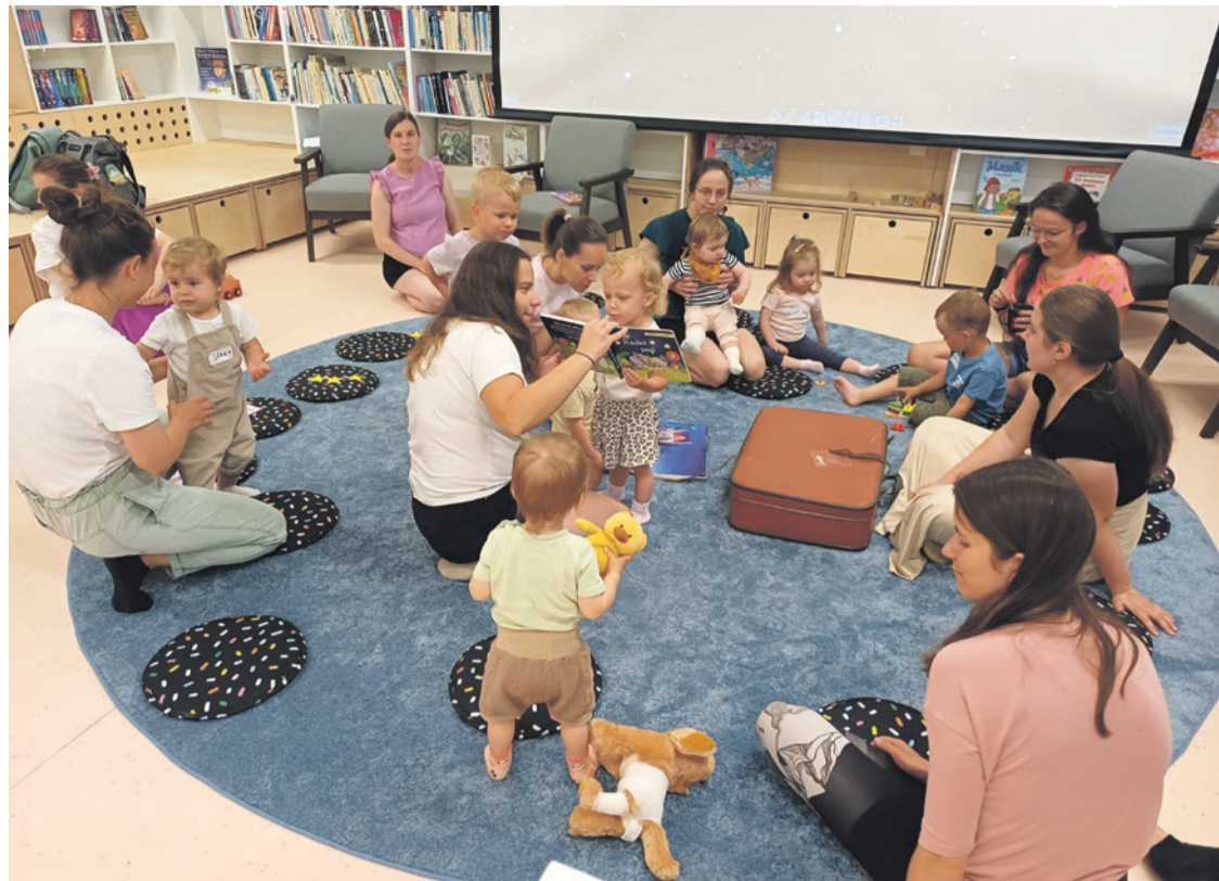
Prvé zoznamovanie s knižkami na pravidelnom pondelkovom Čítaníčku pre najmenších

Na knižnicu sme nezabudli. Pribudlo nám rekordné množstvo nových čitateľov a knižničný fond sme rozšírili o takmer 400 kníh. Medzi novinkami si na svoje prídu milovníci napínavých detektívok, historických