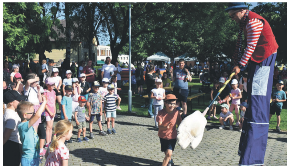
Kto si trúfne na klauna?!