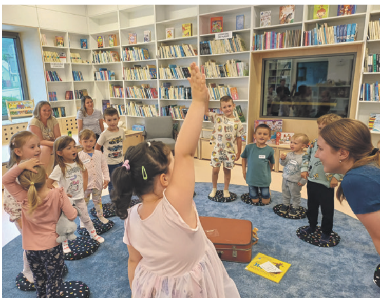
Príbeh a tvorivé hry na Knižkove pre zvedavých škôlkarov