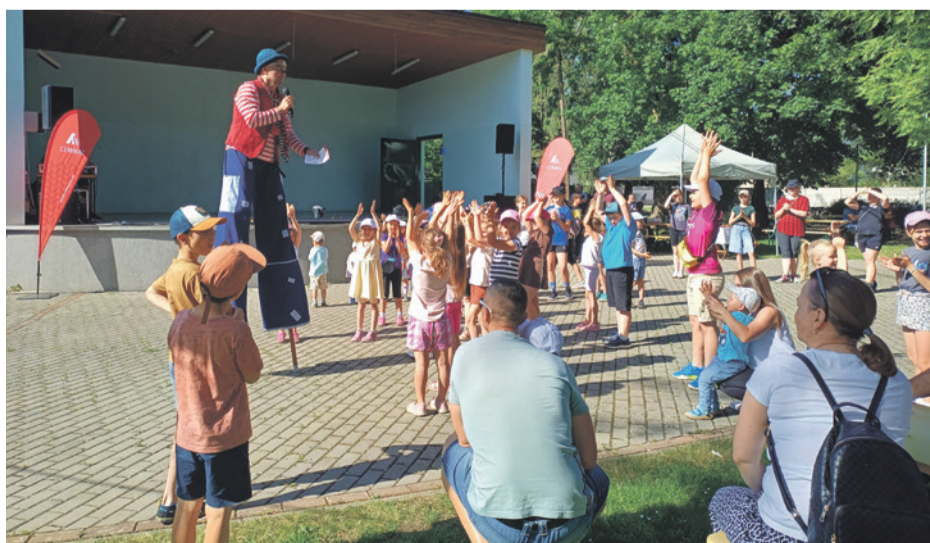
Prehliadnuť tohto zabávača bolo skrátka nemožné