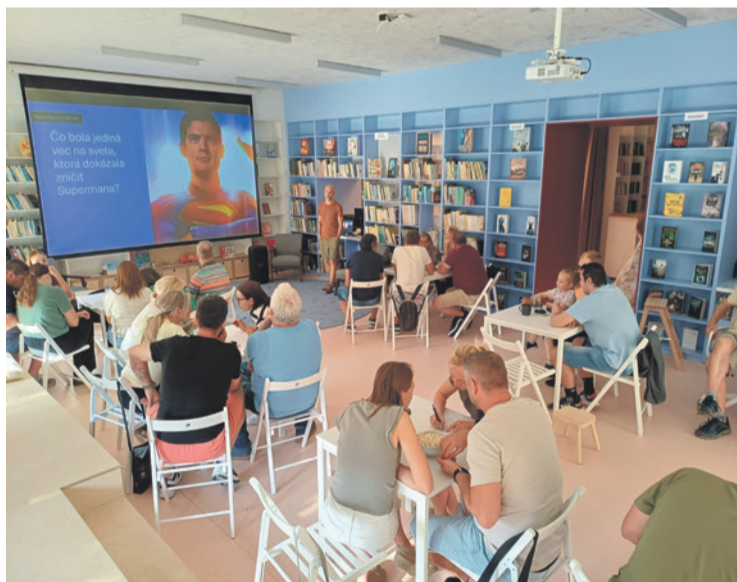
Kvíz preveril vedomosti aj súťaživosť

Počas leta pripravujeme dve špeciálne aktivity, ktoré budú bežať počas celých prázdnin.