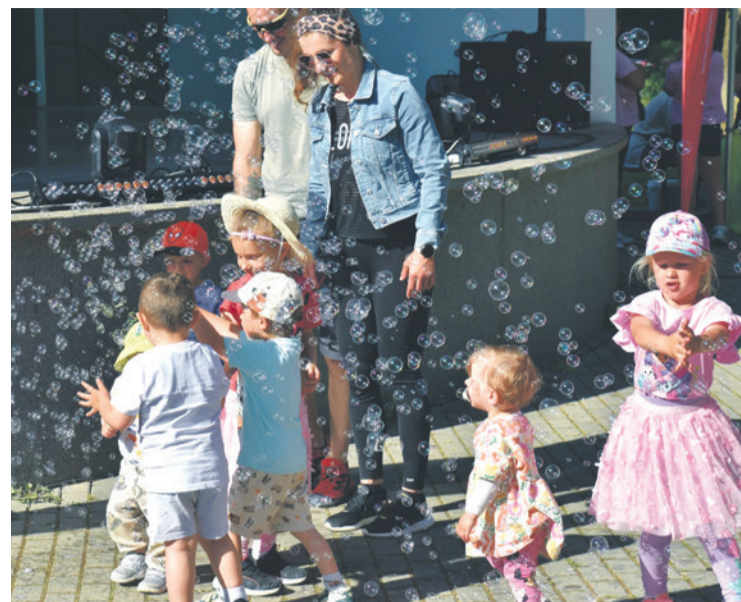
↑ Bublínky potešili hlavne najmenších ← Bublínová smršť pred pódium nenechala deti chladné