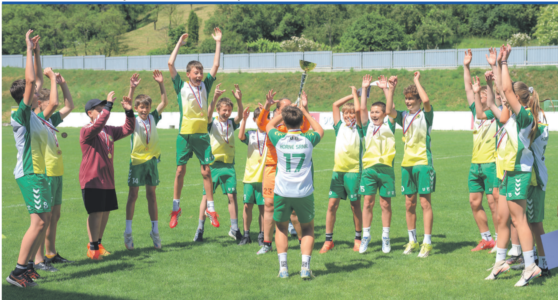
Družstvo U13 sa stalo majstrom oblasti so 14-bodovým náskokom na čele tabuľky. Mladí futbalisti zaznamenali imponantné skóre 112:12 a zaslúžene si vybojovali prvenstvo vo svojej kategórii – gratulujeme! Viac v článku na str. 15

Noviny obce Horné Srnie • lipovec@hornesrnie.sk • ročník XXXV • 2/2026