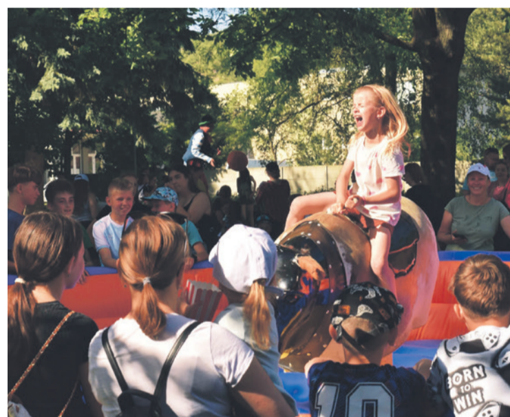
Vydržať na býkovi dlhšie ako minút bolo takmer nemožné