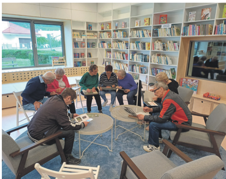
Piatkové stretnutie pamätníkov pri káve a starých fotkách

Prečítané leto je program pre deti a mládež, ktorý ich motivuje čítať aj počas prázdnin. Okolo chotára zas pozve do prírody všetkých, ktorí radi objavujú okolie Horného Srnia. Spoločne spoznáme známe aj menej známe miesta nášho chotára. Veríme, že sa k nám pridáte a strávime spolu príjemné chvíle na čerstvom vzduchu.