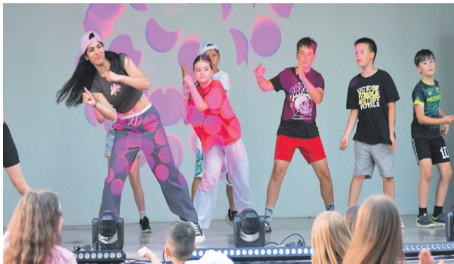
Choreofactory to na pódium poriadne odpálili a rozhýbali aj publikum