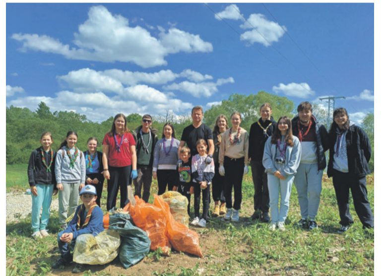
Najviac vriec odpadu sme nazbierali za kurtami, kde sme akciu Čistá obec aj ukončili

Ekologické zmýšľanie a ochrana životného prostredia nie sú len o chránení prírody, ale aj o zabezpečení lepšej budúcnosti pre nás všetkých. Starajme sa o našu planétu, pretože ona sa stará o nás.