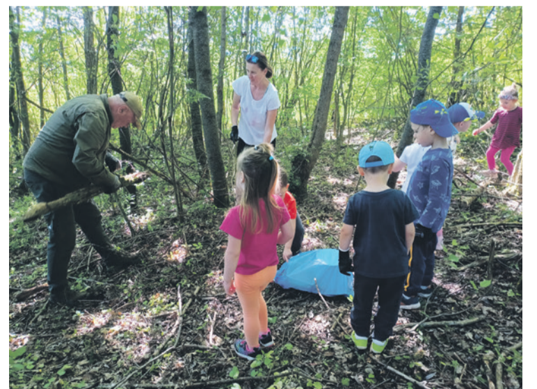
Pán Papierník spoločne so škôlkarmi a pani učiteľkami čistia lesík v Potoku pod Vrškom