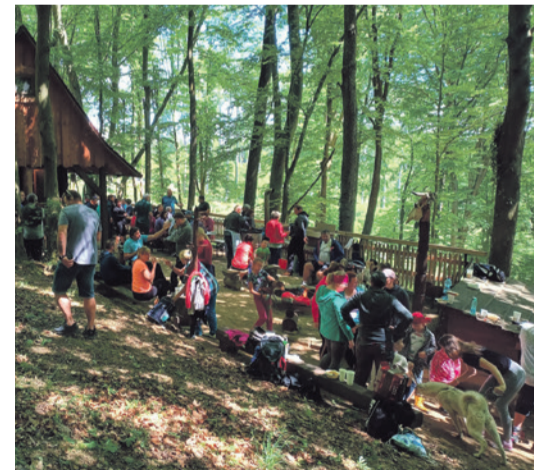
Zaslúžený oddych pri chate