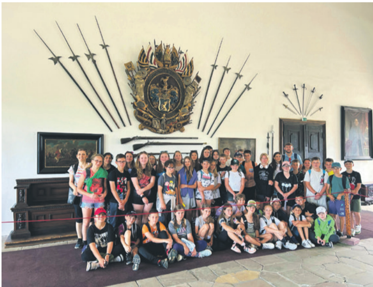
Koncoročný výlet piatokov a šiestakov na hrad Červený Kameň a do jaskyne Driny