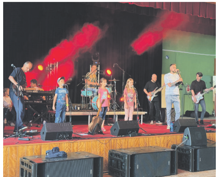
Toddler Punk roztancoval deti i rodičov.