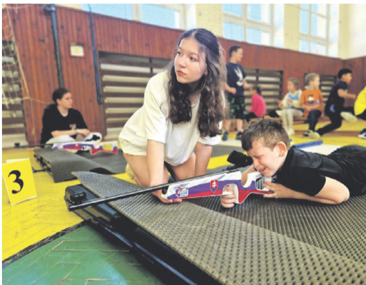
Športový deň – biatlon