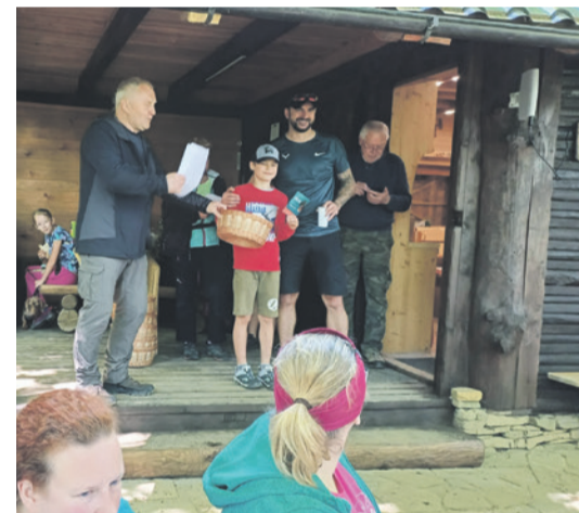
Súťažili aj dvojice rodič a dieťa