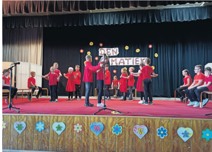
Súčasťou programu bolo aj vystúpenie tretiačov ZŠ.

Paradoxne, Anna Jarvis sa neskôr postavila proti komercializácii sviatku, ktorý sama pomohla založiť. Bola znechutená tým, ako sa Deň matiek stal príležitosťou pre obchodníkov zarábať na predaji a darčekom, čo podľa nej