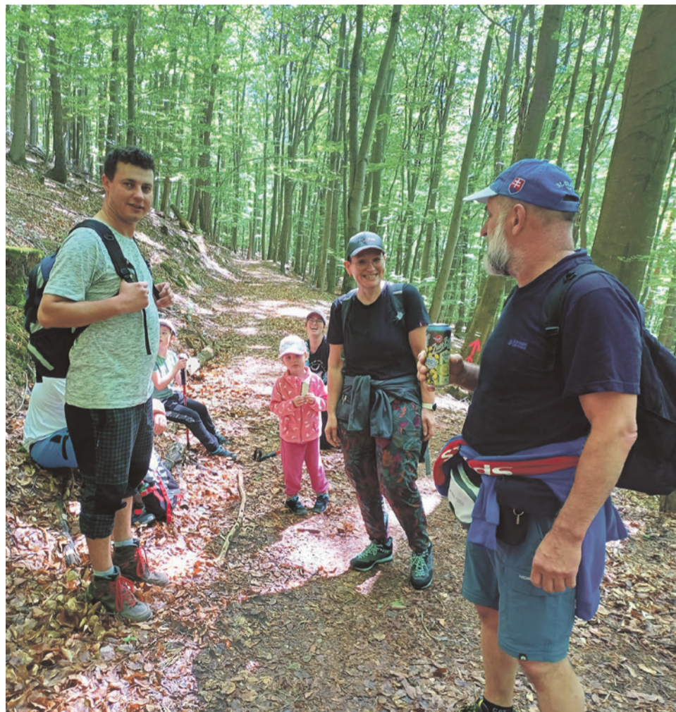
Prestávka počas výstupu po Jarošovom chodníku

T áto akcia sa už tradične stáva jedným z vrcholov miestneho spoločensko-turistického kalendára, a to nielen pre súťažný rozmer, ale aj pre neopakovateľné zážitky a stretnutia. Zdolaj na Srnský vrch už po ôsmy raz organizovala Jednota bývalých urbárikov v spolupráci s obcou. Súťažilo sa v niekoľkých kategóriách, aby si každý mohol nájsť svoju výzvu. Účastníci sa do akcie zapojili s veľkým nasadením a odhodlaním, no aj napriek súťaživému duchu dominovala celou akciou priateľská a veselá atmosféra. Veľa účastníkov sa zúčastnilo podujatia najmä kvôli spoločenskému rozmeru. Výstup na Srnský vrch bol príležitosťou stretnutí starých známych, nadviazať nové priateľstvá a stráviť deň v prírode v dobrej spoločnosti. Počas cesty bolo možné počuť spev aj hudbu harmoniky. Viaceré skupinky turistov si takto spríjemňovali cestu a dodávali celej akcii jedinečný ráz. Po náročnom, ale zábavnom výstupe na Srnský vrch čakala všetkých účastníkov v cieľi zaslúžená odmena. Každý dostal porciu chutného gulášu a chladené pivo, príp. kofolu. Spoločné posedenie pri jedle a nápojoch len umocnilo priateľskú atmosféru a poskytlo príležitosť na ďalšie rozhovory a zábavu. Aj keď deň pred akciou a deň po nej silno pršalo, počas samotného výstupu panovalo krásne počasie.