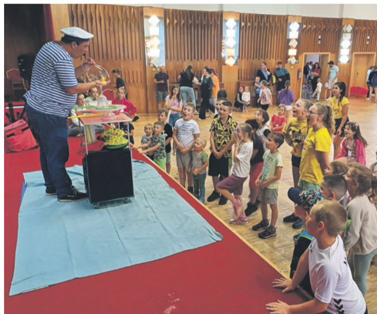
Mr. Bubble v akcii - ohúril malých aj veľkých

Spočiatku tento deň vyzeral veľmi nádejne, no behom 5 sa to minút úplne zmenilo. Celý program sa musel presunúť do budovy školy a neskôr do veľkej sály kultúrneho domu. Zatiaľ čo si deti vychutnávali divadielko v priestoroch školy, hlavy, ruky, telefóny a autá rodičov sa nezastavili, aby tento deň, ktorý bol krásne naplánovaný, zachránili. Opäť sa ukázalo, že keď sa chce, tak sa dá a všetko behom 30 minút dokázali presunúť do veľkej sály (poviem vám, bolo to ako včielky v úli), každý vedel,