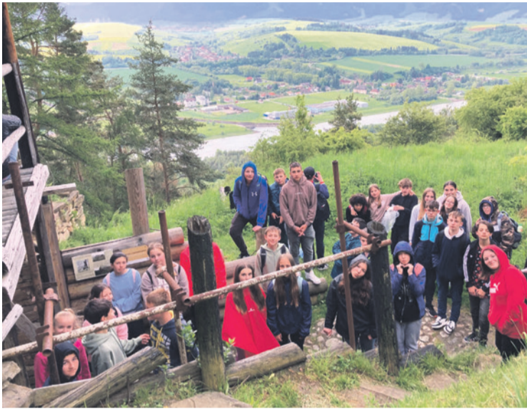
Na Liptove si siedmci nenechali ujsť návštevu archeoskanzenu Havránok

a pomedzi ne je treba prebrať učivo, uzatvoriť známky, rozlúčiť sa s deviatakmi a pripraviť všetko na plynulý nábeh nového školského roka. To najzaujímavejšie, čo sme zažili od apríla do júna, nájdete aj na našej webovej stránke https://zshsrnie.edupage.org