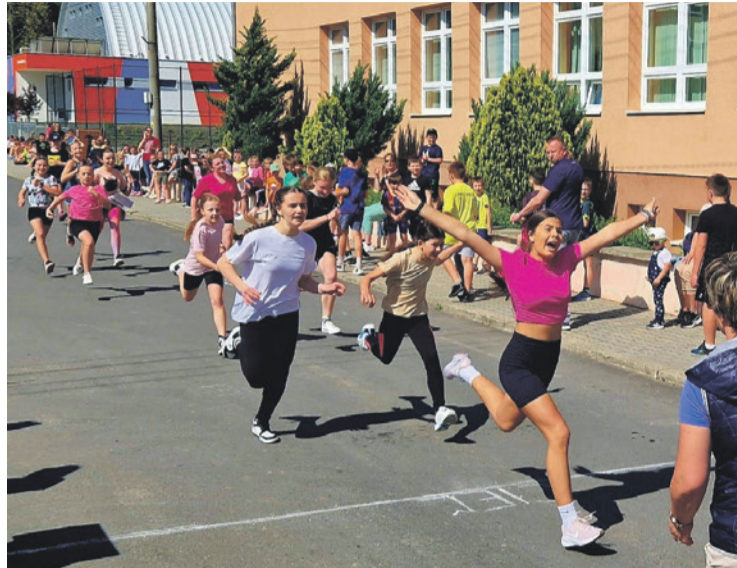
Športový deň – beh oslobodenia