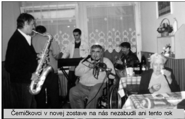
Čemičkovci v novej zostave na nás nezabudli ani tento rok

Okrem hĺbkovej kontroly, verejných obstarávaní na projektovú dokumentáciu a dodávku stavebno-inštalačných prác „Rekonštrukcie a modernizácie plynovej kotolne“, ktorá je v súčasnosti už nainštalovaná a prebieha preberacie konanie. Celá táto akcia vrátane projektovej dokumentácie stála 904 tis. Sk, bola financovaná z troch zdrojov. Z lotérií sme dostali príspevok 500 tis. Sk, 400 tis. Sk bola dotácia