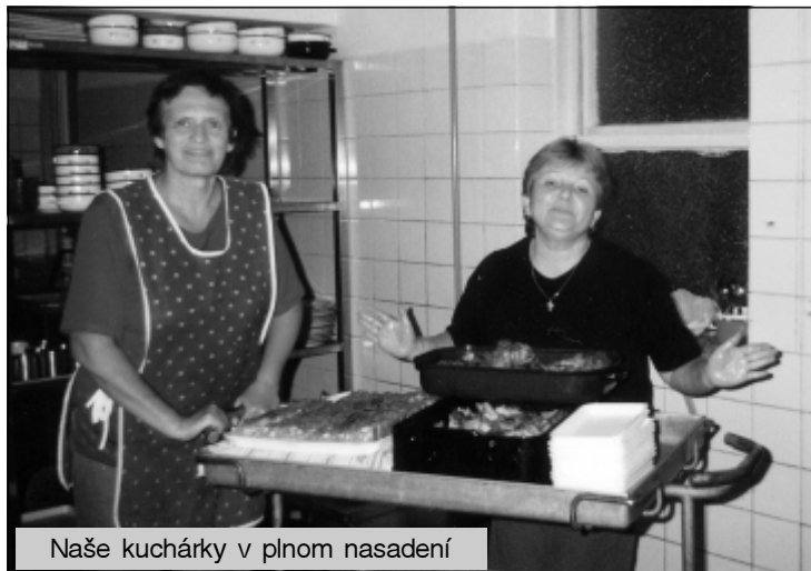
Naše kuchárky v plnom nasadení

Tento rok nám počasie neprialo, tak sa bál musel konať v spoločenskej miestnosti. Keďže sa po minulé roky tancovalo na nádvorí a