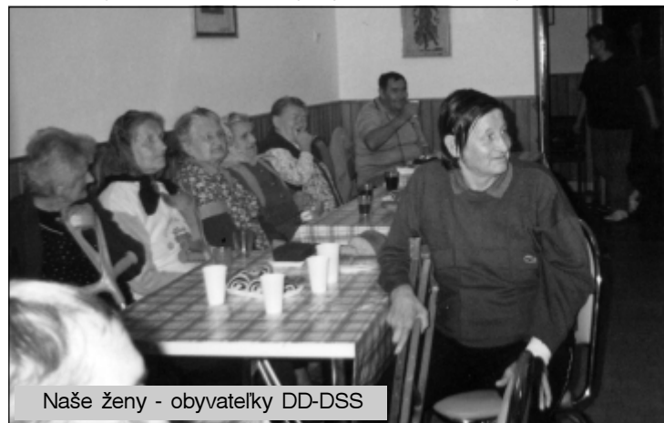
Naše ženy - obyvateľky DD-DSS

jedálni a v ambulancii a zabezpečiť inštaláciu nového veľkokapacitného sporáka plyn-elektro. V súčasnosti je už aj na túto akciu ukončené verejné obstarávanie a podpísaná zmluva na jeho dodávku.