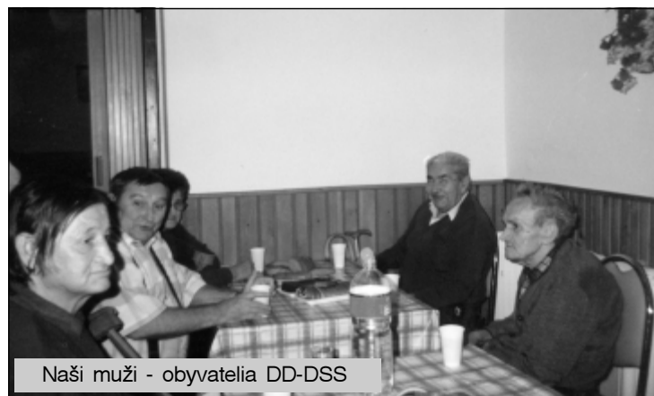
Naši muži - obyvatelia DD-DSS

Ak sa nám toto všetko podarí, bude začiatok decembra a to je čas, keď poviem svojim najbližším zamestnancom (a oni to už dobre poznajú), že na budúci rok nebudem určite nič robiť, ale na druhý deň začnem potichu plánovať rok nasledujúci.