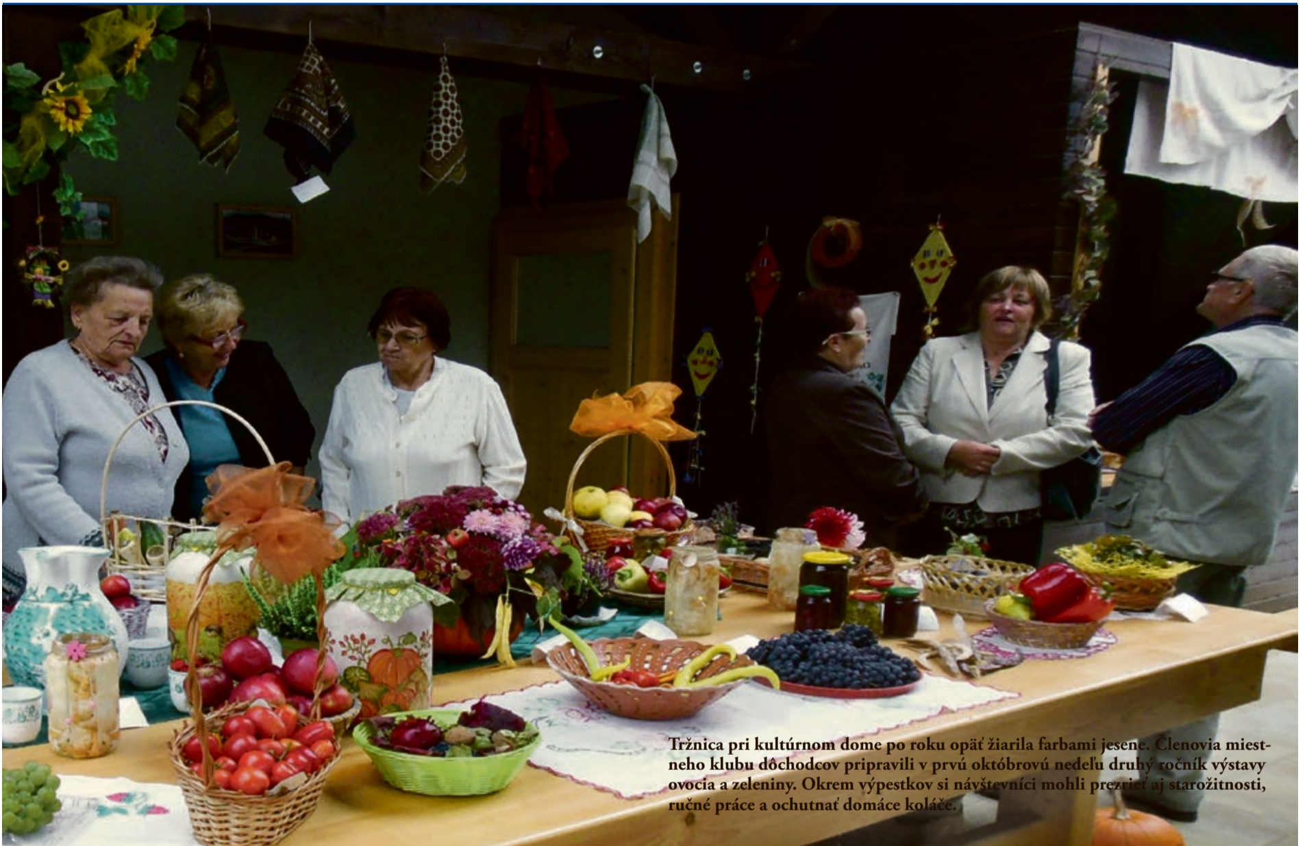
Tržnica pri kultúrnom dome po roku opäť žiarila farbami jesene. Členovia miestneho klubu dôchodcov pripravili v prvú októbrovú nedeľu druhý ročník výstavy ovocia a zeleniny. Okrem výpestkov si návštevníci mohli prezrieť aj starožitnosti, ručné práce a ochutnať domáce koláče.