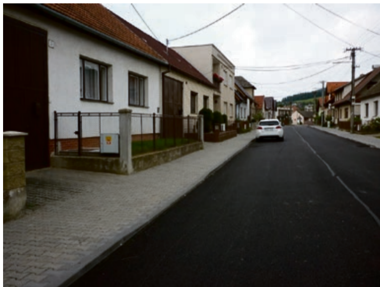
Vodiči áut už na Súhrade nemusia trénovať jazdu zručnosti