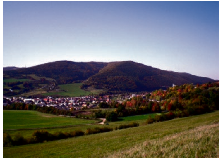
Hoci sú Kremenice pomerne nízky kopec, odmenia nás pekným výhľadom na dedinu, ale i širšie okolie.

Po modrej turistickej značke sa dostaneme hore po Jarošovom chodníku na Srnský vrch, pri chate sa občerstvíme. Pod chatu vedie chotárna cesta, po ktorej môžeme zostúpiť do Ihličného a dole Lánmi do dediny. Je to 8 km, cca 2,5 hodiny. Môžeme ale pokračovať ďalej po modrej značke na Lipovec – Rokytku. Odtiaľ dole Rokytkou a Bradelciami na cyklozrub. Po cyklotrase do dediny je to asi 14 km a 4 hodiny. Na Rokytke ale môžeme