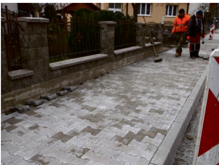
Rekonštrukcia chodníka na Kameneckej ulici

Spracovanie projektovej dokumentácie Riešenie havarijného stavu vykurovania na ZŠ Václava Mítúcha v Hornom