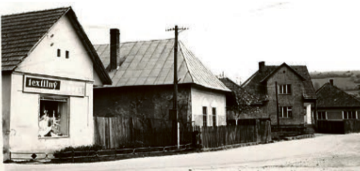
Starý textil v parku oproti dnešnej predajni CBA