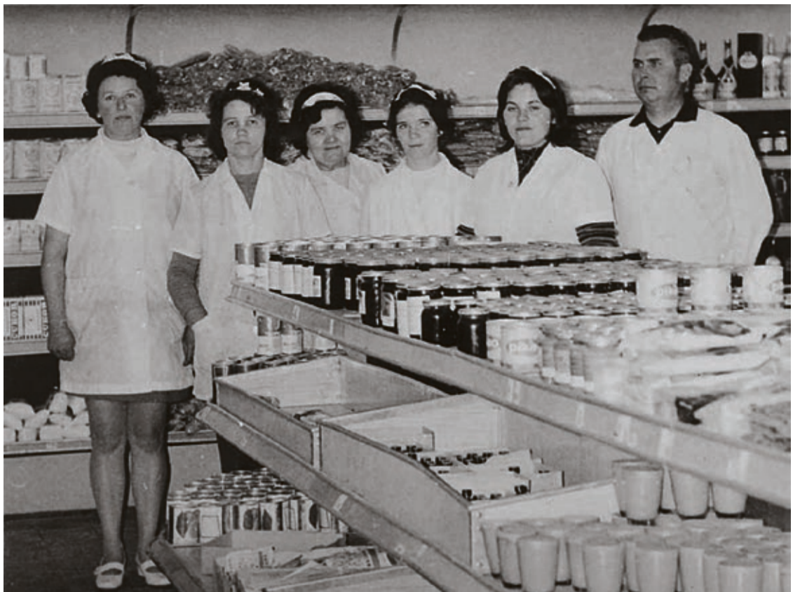
Zamestnanci Jednoty na Súhradskej ulici – 70. roky