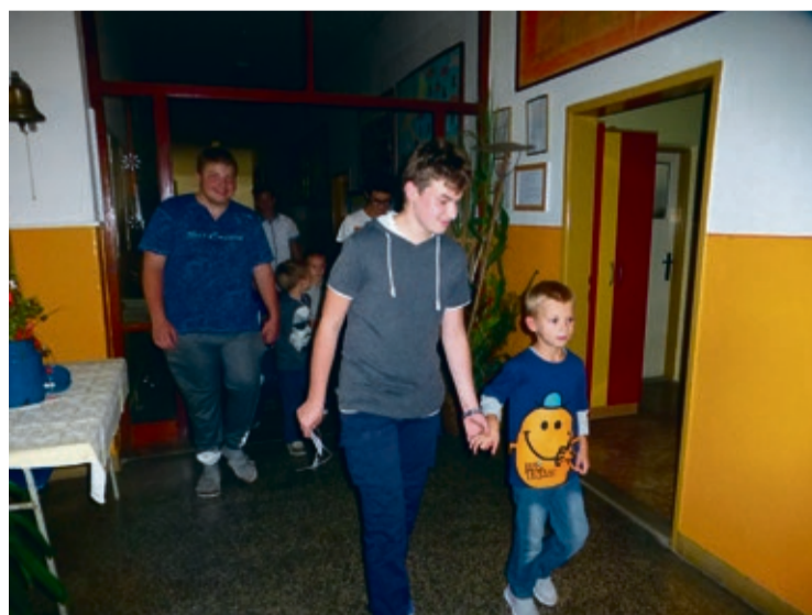
Naši prváci ruka v ruke s deviatkami spoznávali všetky zákutia školy