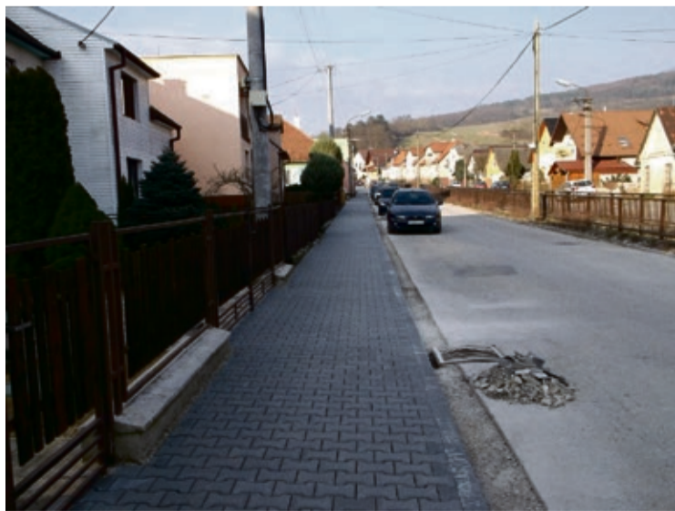
Zrekonštruovaný chodník Na Hornom konci