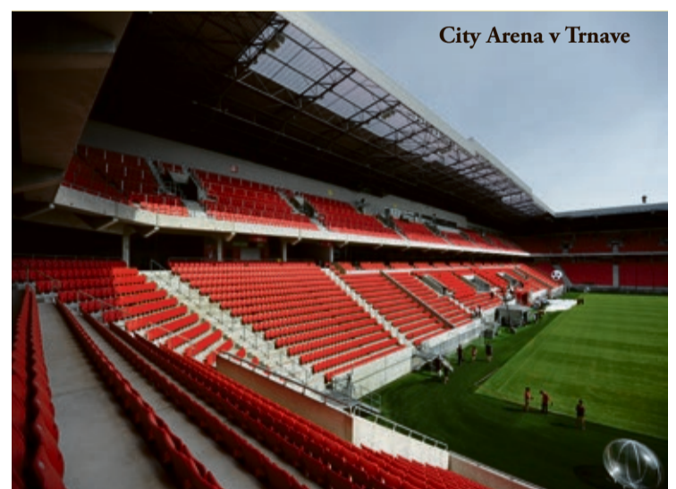
City Arena v Trnave