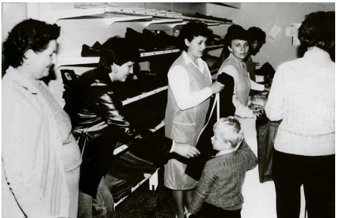
Otvorenie predajne Textil – Odevy, ktoré sídlilo v priestoroch predajne CBA