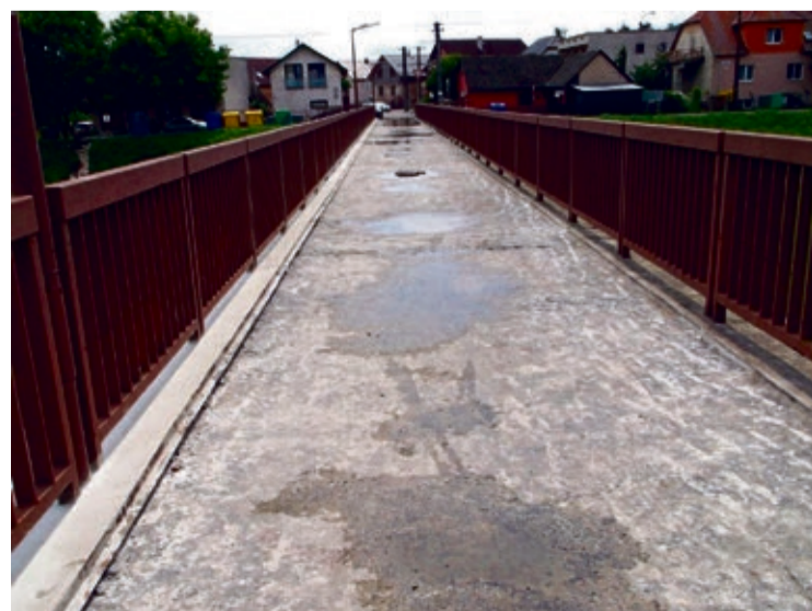
Horný most bol v dezolátnom stave