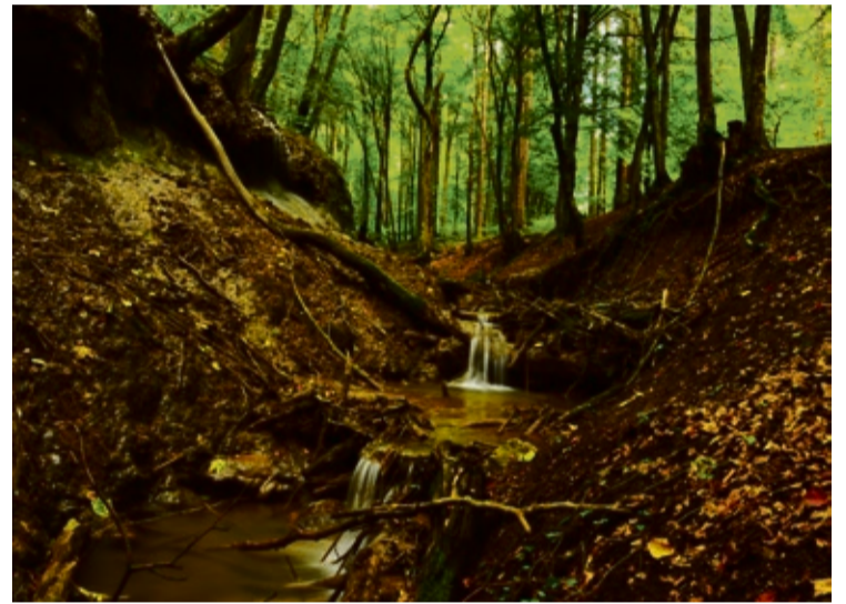
Dračia studňa je najkrajšia v jeseni, keď jej okolie sfarbia padajúce listy.

ďalej pokračovať po modrej značke, ktorá pod Hrachovým ústí do červenej turistickej značky a dovedie nás na Grófovú. Z Grófovej po žltej turistickej značke zídeme cez smutný jarok do Antonstálu. Prejdeme okolo pietneho miesta, kde počas 2. svetovej vojny dopadol Americký bombardér B-25. Obzrieme si lovecký zámok a dole dolinou zamierime do