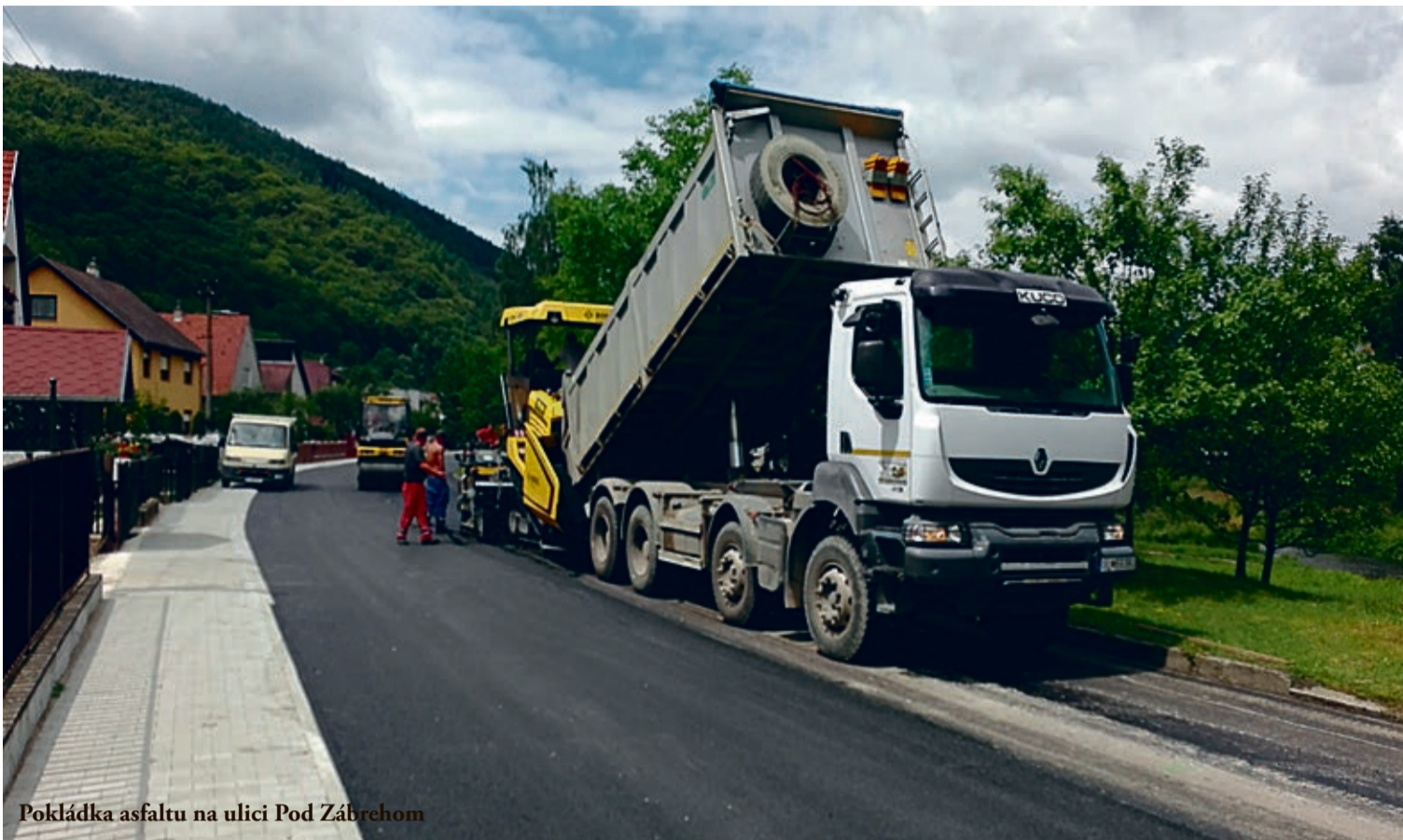
Pokládka asfaltu na ulici Pod Zábrehom